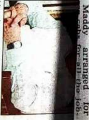
Manoj Lal Khattar are trying to prepare a narrative for their defeat

"They trained us on how to execute crypto investment frauds. Instructions were given on how to re-